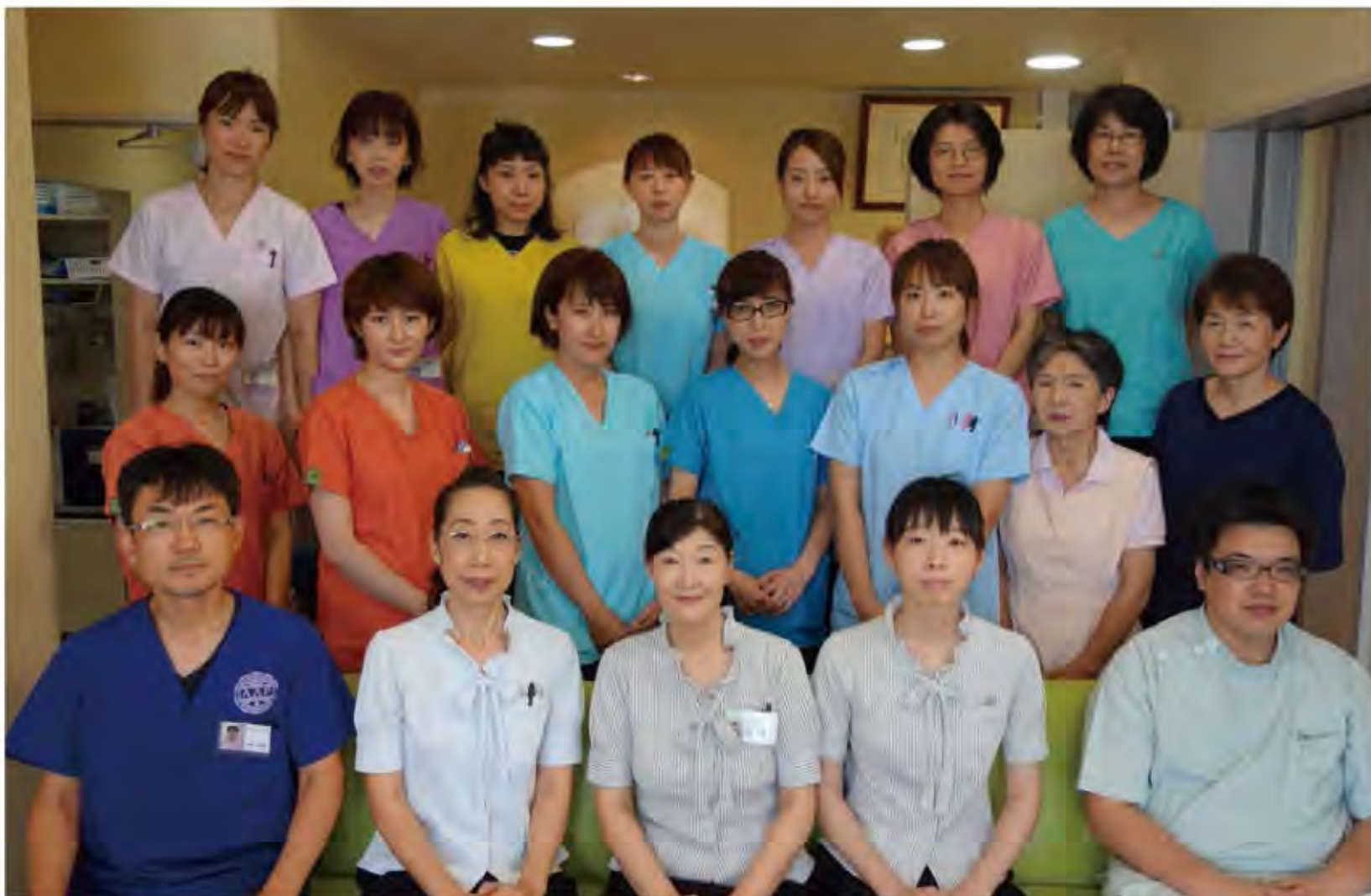
M, デンタルクリニックの皆様。とても明るい雰囲気です。

何 事も最初が肝心と言います。皆さまで、まにとつて一番大切なのは、まず予防歯科や、それに関連する健康であることの価値に興味を持って頂く事です。そして理解から気付きへと変わり、希望を実感することが出来ます。