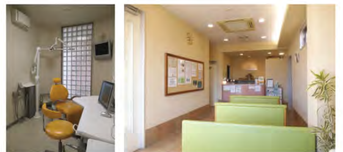
清潔感が漂うクリニックの外観・待合室・メインテナンスルーム。